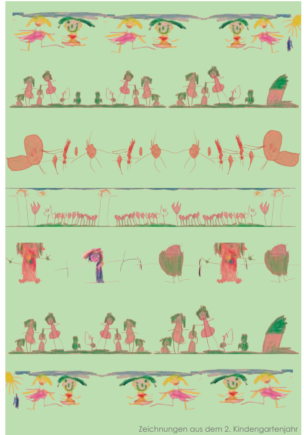
Zeichnungen aus dem 2. Kindergartenjahr