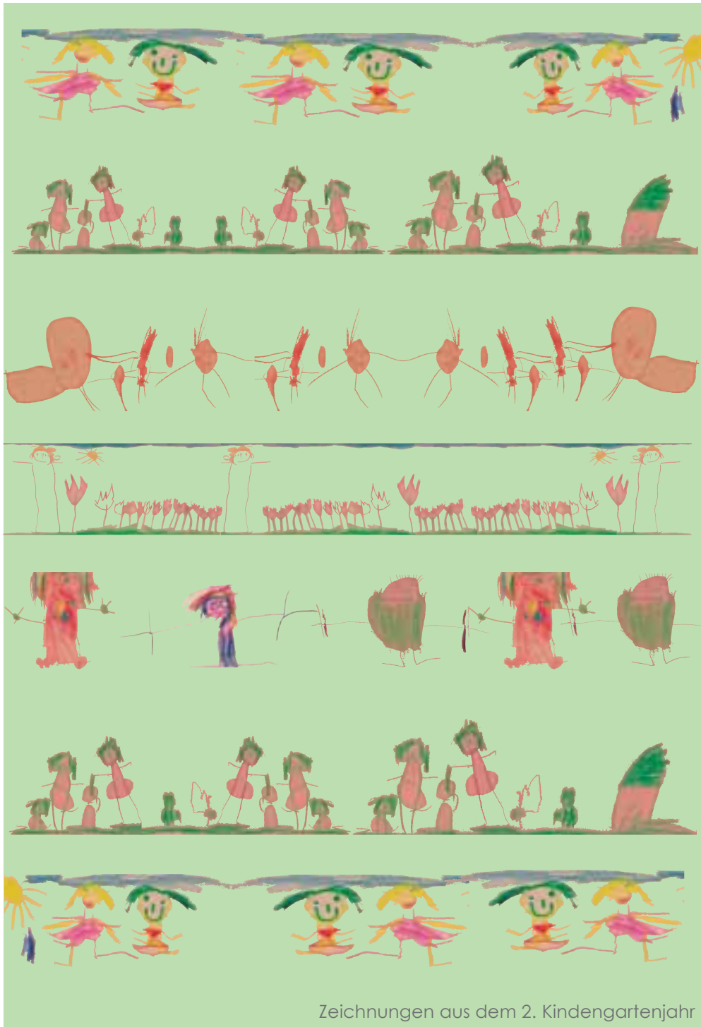
Zeichnungen aus dem 2. Kindergartenjahr