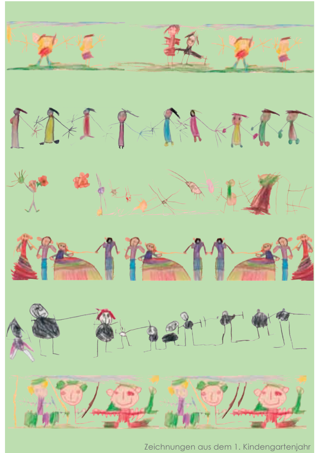
Zeichnungen aus dem 1. Kindergartenjahr