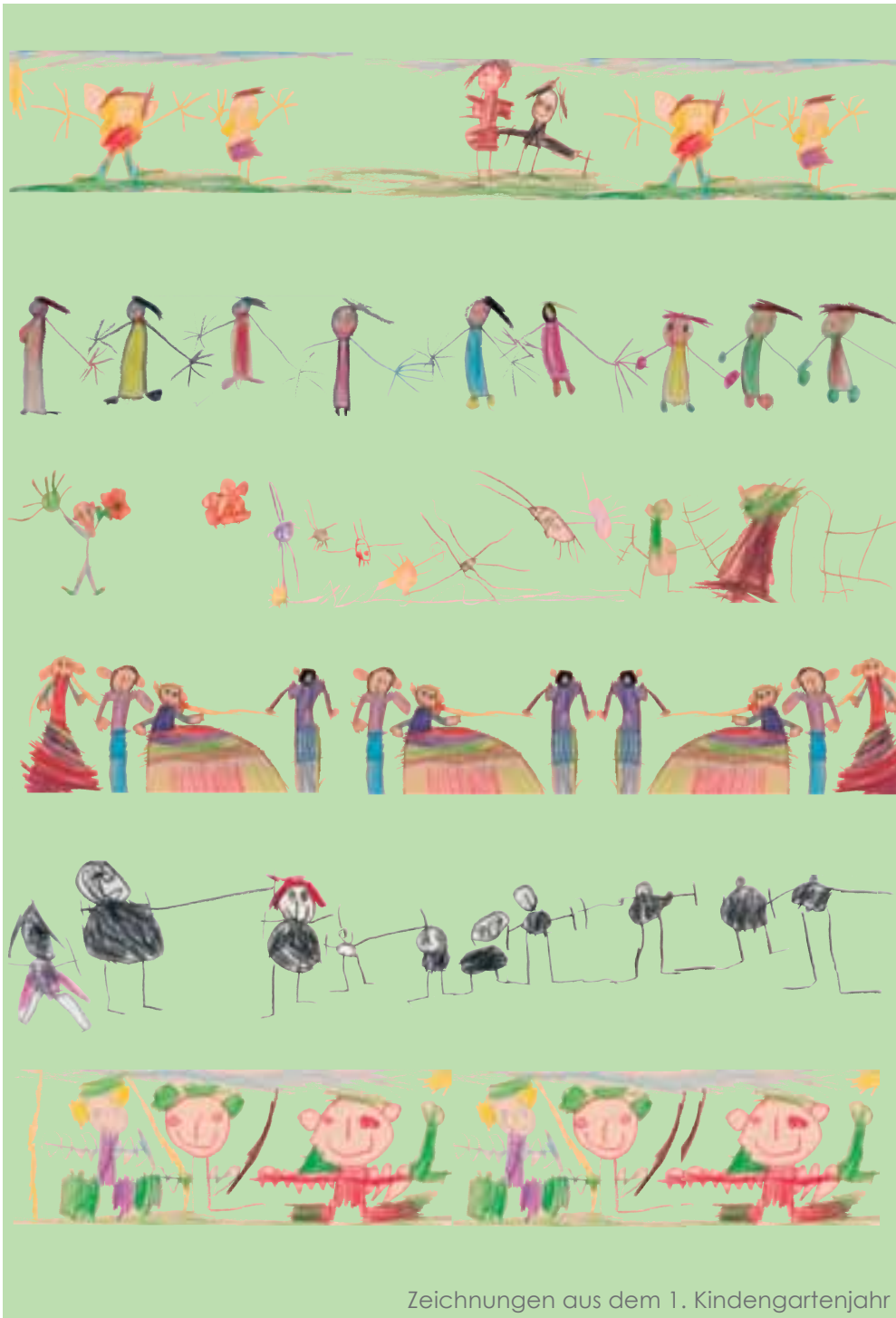
Zeichnungen aus dem 1. Kindergartenjahr